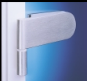
Studio Rondo: Linienführung mit schwungvollem Bogen.