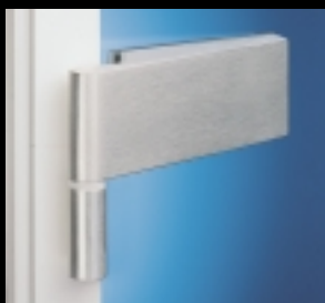
Studio Classic: wo Geradlinigkeit Trumpf ist.