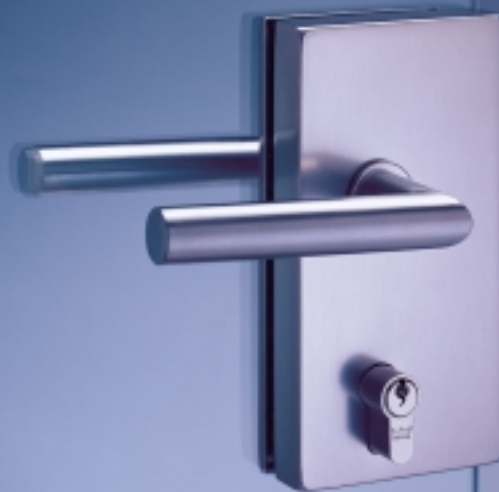
Junior Office Classic

Anmerkung aus der DIN 18 251, Klasse 3: „Die Schlösser werden u.a. für Wohnungsabschlusstüren und öffentliche Bauten (so genannte Objektschlösser) empfohlen.“